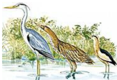
Héron cendré - Butor étoilé Blongios nain (de gauche à droite)

Des marécages d'origine, inhospitaliers, les moines médiévaux ont fait des jardins, drainés par une multitude de canaux. L'extraction de la tourbe y a créé plus tard des chapelets d'étangs. Aujourd'hui, ces zones humides, à la fois sauvages et très fréquentées par l'Homme, abritent une multitude d'oiseaux qui se laissent observer. Elles sont aussi le paradis des chasseurs et des pêcheurs à la ligne !